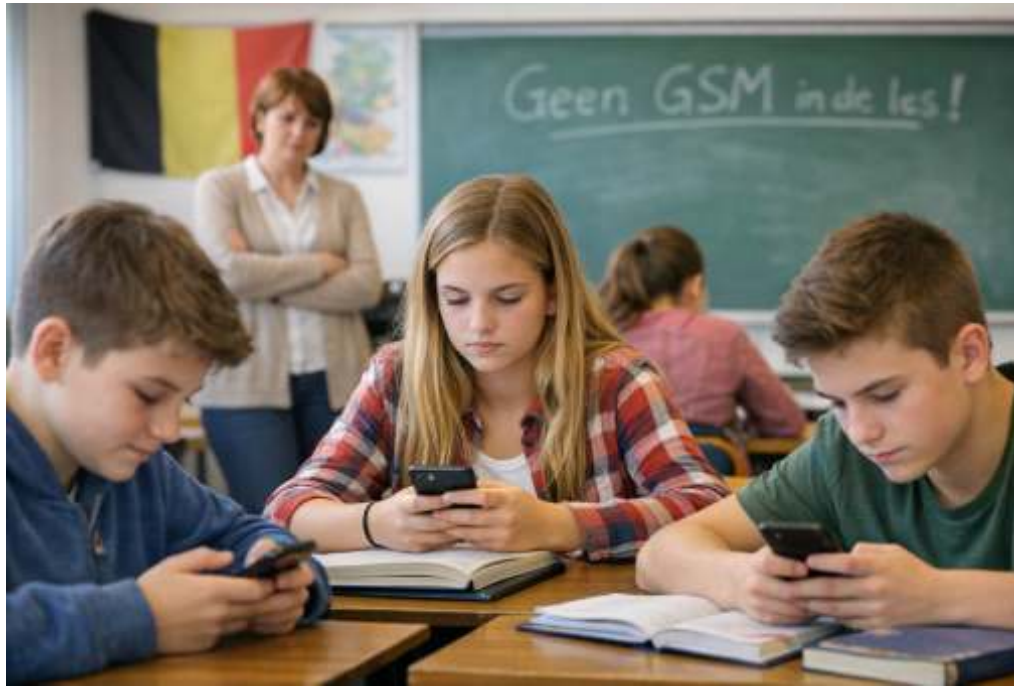
Informatie opzoeken op de smartphone: nuttig of niet?

Wat opvalt: scholen die duidelijke, consequent toegepaste regels hantieren, rapporteren minder conflicten. Niet omdat jongeren plots minder gehecht zijn aan hun toestel, maar omdat duidelijkheid rust brengt.