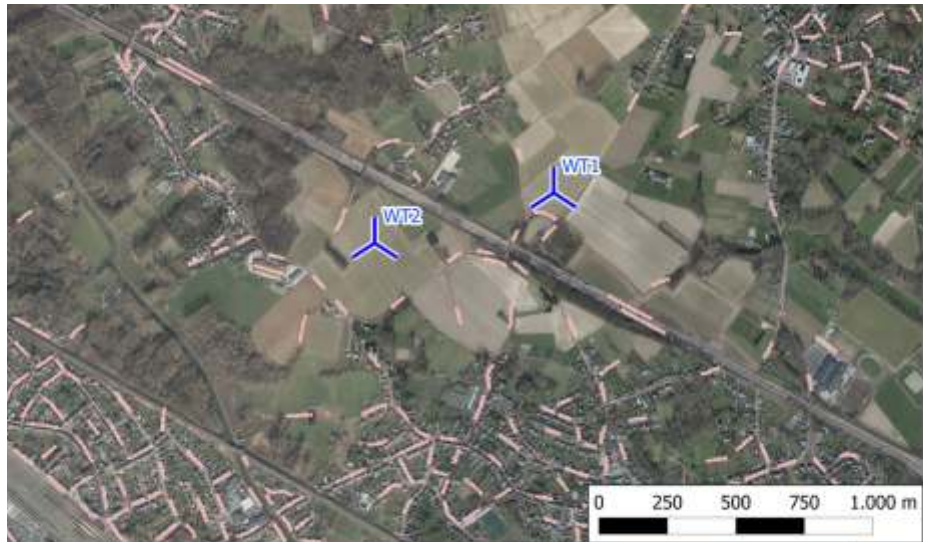
Omgevingskaart met aanduiding waar de windturbines gebouwd zullen worden.

gemeente Affligem optimaal benut. De twee windturbines zouden in totaal goed zijn voor een elektriciteitsproductie van 21 600 megawattuur per jaar, wat overeenkomt met 12% van het energieverbruik in Affligem en een jaarlijkse CO2-besparing van ca. 10000 ton."